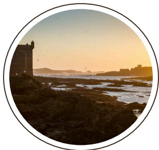
17/05 CIAMPINO- MARRAKECH-ESSAOUIRA